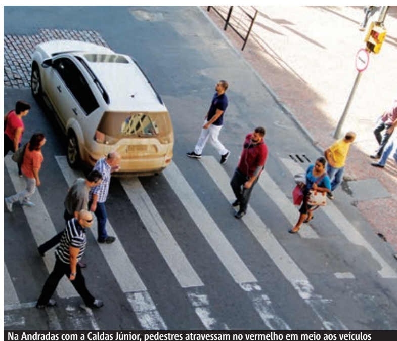
Na Andradas com a Caldas Júnior, pedestres atravessam no vermelho em meio aos veículos

Na Rua dos Andradas com a Caldas Júnior, também no Centro, a sinaleira é praticamente ignorada por quem está a pé. Pessoas atravessam a cinco metros de distância da faixa, apesar de haver grades para direcionar a travessia correta. Mesmo com sinal verde para si, alguns motoristas precisam parar porque pedestres estão atravessando. Será possível mudar esse cenário?